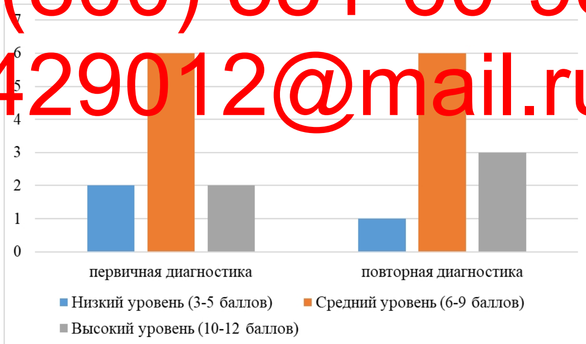
Рисунок 1 – Гистограммы частот уровня сформированности коммуникативных умений по методике «Рукавички»